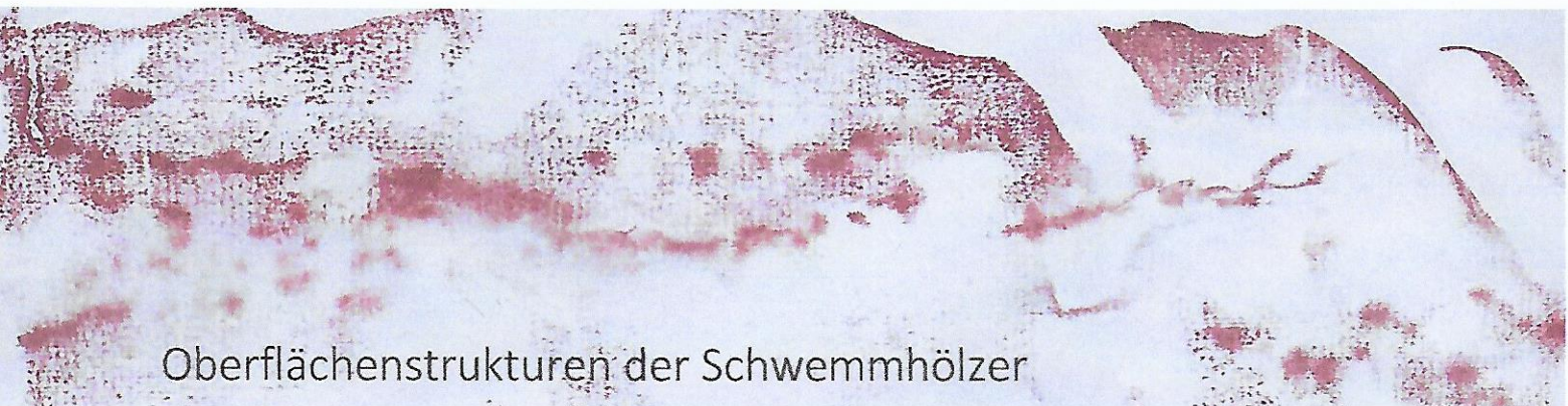
Oberflächenstrukturen der Schwemmhölzer

Gelebtes, vergängliches Holz aus dem Wasser inspiriert zu Neuem im Gestaltungsprozess